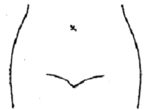
(ストマ及びびらんの部位等を図示)