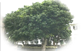
シンボルツリー リュウキュウエノキ