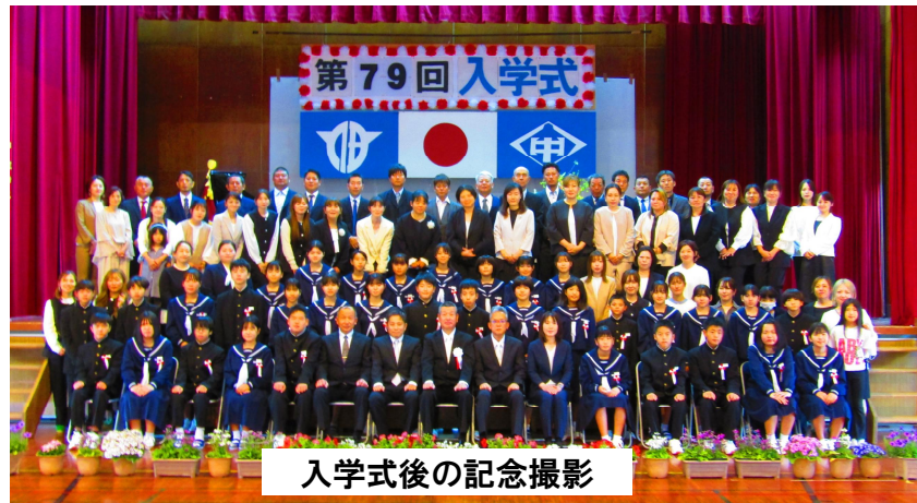
入学式後の記念撮影

伊仙中学校の校訓は「前進」です。新生を含めた105名全員の想いを一つにして、日々前進していけるように頑張っていきたいと思います。