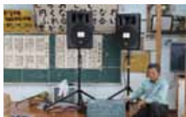
木之香集落自治会

この事業は宝くじ助成金で実施されています。集落自治会活動の充実・強化を図るため、集落行事などで使用する活動備品等を整備する事業です。今年度は、小島集落自治会、上晴集落自治会、中伊仙西集落自治会、木之香集落自治会の4集落に、要望した備品が整備されました。