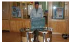
中伊仙西集落自治会