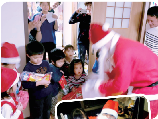
伊仙町連合青年団

今後も様々な趣向を凝らし、子どもたちにとって、今以上に楽しく、い つまでも夢を大切にしてもらえようような事業にしていこうと思います。 ご要望やご意見等がございましたら青年団にどうぞご連絡下さい。