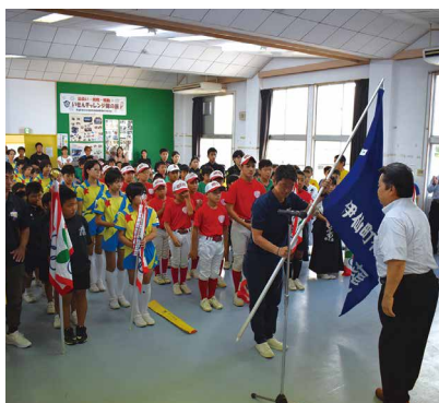
体育協会長から選手団へ体協旗が手渡されました

伊仙町中央公民館で、第73回県民体育大会、第60回大島地区大会並びに第46回大島地区スポーツ少年団競技別交歓大会の合同結団式が開催されました。各種目に出場する選手の皆さんが集まり、総勢19団体が合同結団式に参加しました。奄美群島内の12市町村から出場する選手たちによって、熱戦が繰り