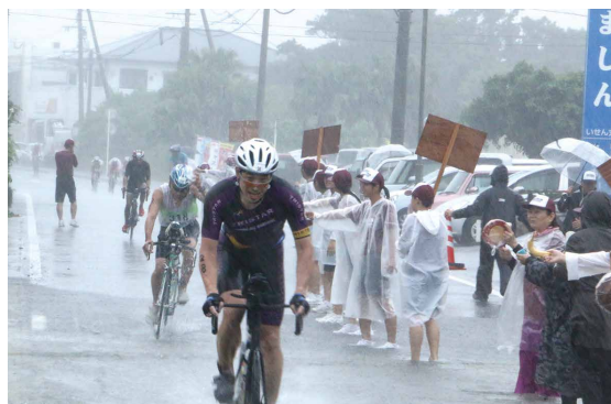
続々とエイドステーションを通過する選手たち