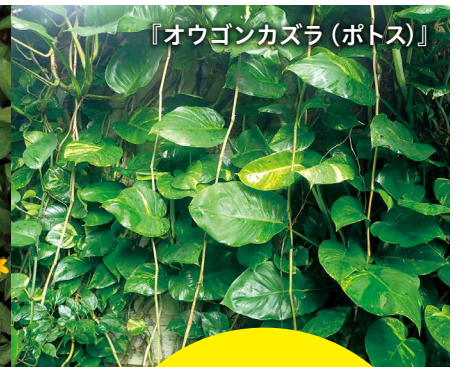
『オウゴンカズラ(ポトス)』