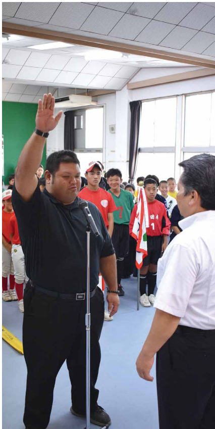
大会への意気込みを込めて選手宣誓