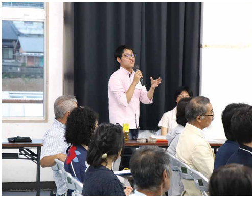
ランに関する質問について、説明を行う講師

講演後には、動植物の生態についての質問や今後の保全についての意見交換がありました。参加者からは「徳之島にこれだけ多くの希少な動植物がいることにびっくりした」「自分の知らないことが多くてすごく勉強になった。今後も色々な講演会に足を運びたい」との感想が聞かれました。