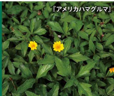
『アメリカハマグルマ』