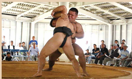
持ち前のパワーを生かし豪快に寄り切る中選手