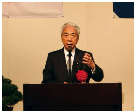
元厚生労働大臣 尾辻 秀久 参議院議員

基調講演1「増え続ける社会保障費から見るこれからの地域」においては、元厚生労働大臣 尾辻参議院議員が登壇し、社会保障費に関する資料を示しながら、「人口減少が進むなかで、社会保障を考えていかなければならない」と話しました。また、内閣府のCCRC(生涯活躍のまち)の地域再生計画制度の対象として、全国自治体の中の21自治体の一つとして、伊仙町が選定を受け