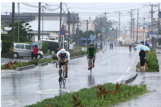
雨の中でも、傘を差しながら応援する光景が見られました