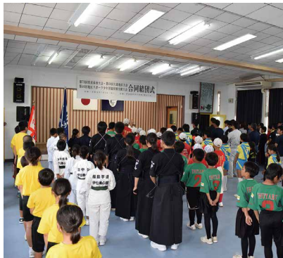
大会に向けて、結束する選手団

伊仙町中央公民館で、第73回県民体育大会、第60回大島地区大会並びに第46回大島地区スポーツ少年団競技別交歓大会の合同結団式が開催されました。各種目に出場する選手の皆さんが集まり、総勢19団体が合同結団式に参加しました。奄美群島内の12市町村から出場する選手たちによって、熱戦が繰り