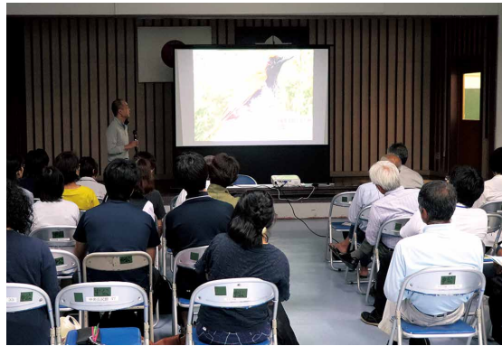
アカヒゲの生態に関するスライド説明