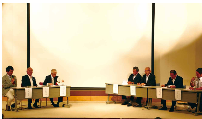
パネルディスカッションでは、徳之島の課題や今後の取り組みについて意見交換

パネルディスカッションでは、当日来場者から回収したアンケートに書かれた意見や課題が取り上げられ、「健康づくり」「独居問題」「小児科医の充実」などについて意見交換がありました。独居問題については「都会では独居が多すぎて難しい面もあるが、徳之島の素晴らしいところは、地域で見守る環境があること」