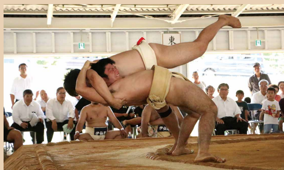
土俵際まで、押し込まれながらも体を大きく反って逆転の投げを狙う