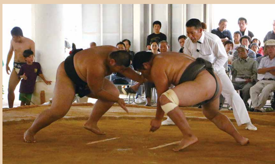
低い姿勢で頭からぶつかり合う高校生の取り組み