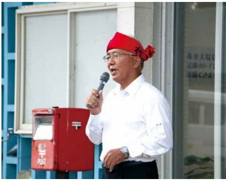
夏植え面積拡大に向けて、関係者へ激励のあいさつを行なう大久保 町長

日差しの強い高温時に作業を行う際には、水分をこまめに取りながら、時折休息を挟むなど、熱中症には十分注意しましょう。