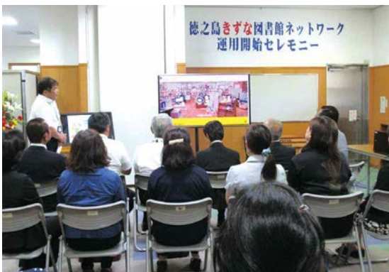
共同利用型図書館ネットワークの説明