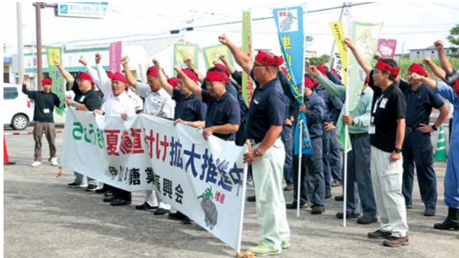
関係者全員で頑張ろう三唱を行いました