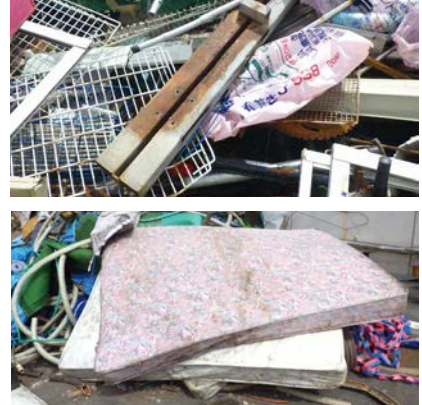
鉄骨 スプリングベッド

「廃棄物の処理及び清掃に関する法律」の中に「国民の責務」という項目があります。そのなかで、