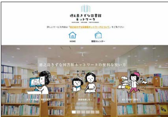
徳之島きずな図書館ネットワークのホームページ

徳之島三町の図書館(室)をインターネットで結び、三町どこでも本の貸出・返却が可能となりました。また、携帯電話やパソコン等から蔵書の検索・予約ができ、利用者へのサービスが向上しました。小さいお子様の読み聞かせ用の絵本を探したり、郷土資料を探したり効率的に探すことが可能です。図書館(室)が主催する行事やイベントなどの告知なども行われていますので、ぜひご利用ください。