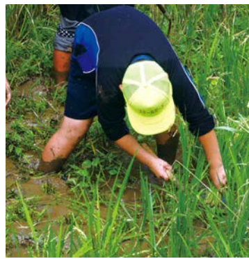
根本から手際よく刈り取る児童