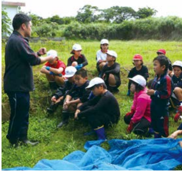
鎌を使う際の注意事項について、説明がありました

後半に保護者と集落の方々も参加して、餅つき大会が行われ、お餅が振る舞われる予定です。今年も、例年と比べると生育が悪く、収量はあまりありませんでした。子どもたちに話を聞くと「足元がぬかるんでいて、やりにくかったけど、できて良かった」「根元に鎌を引っ付けてできた」「人に向けて鎌は使わない」など、稲刈りを通して、鎌の使い方や安全面について学びがありました。