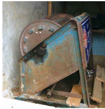
現在も使用している足踏み脱穀機