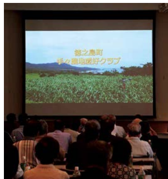
第2部 各組織による事例発表

第2部の事例発表では、景観形成活動について徳之島三町から各1組織が発表を行いました。子ども会や青年団などと協力した清掃活動による景観保全の取り組みなどが紹介されました。各組織で、課題となっているのが参加者の固定化及び高齢化ということです。若手の農業従事者に活躍してもらい、集落を引っ張ってもらうことが望ましいと語り、後継者育成をしていかなければ、なかなか難しいと現状の課題も浮き彫りとなりました。