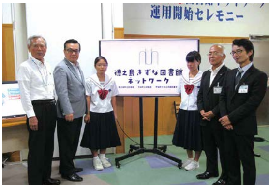
鹿児島県内で2例目となる運用がスタート