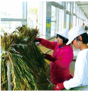
ヒモでくくって、稲穂を集めます