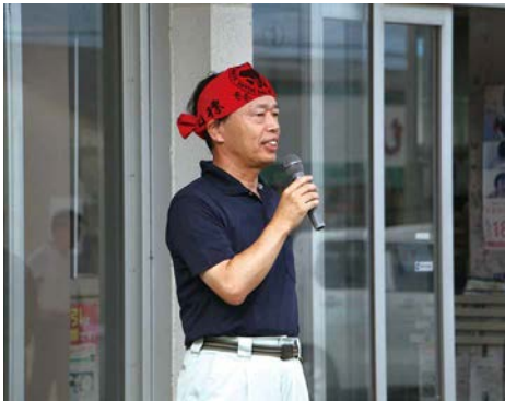
南西糖業から今期のさとうきびの作付面積などについて、報告説明がありました