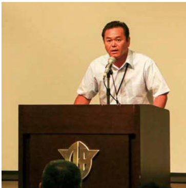
水土里サークル活動支援協議会から各組織へ伝達事項の説明がありました

耕作放棄地の問題については「農地とは先人たちの血と汗と涙の結晶ですよ。先人が何千回と耕してきたことが、今につながっています」と述べ、次の世代へ農地を受け継ぐために、これからも誇りを持って頑張ってくださいと講演を締めくくりました。