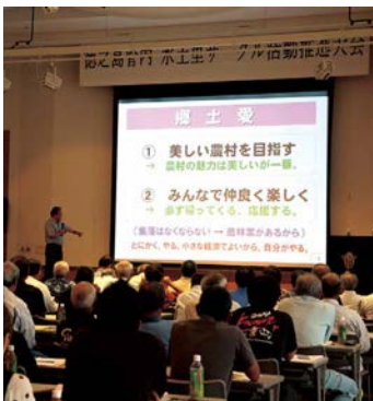
第1部 講演会「むらを育てる」