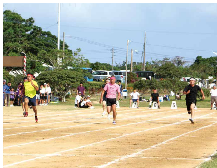
⑩ ハイレベルなメンバーが揃った100メートル走 (50歳以上男子)