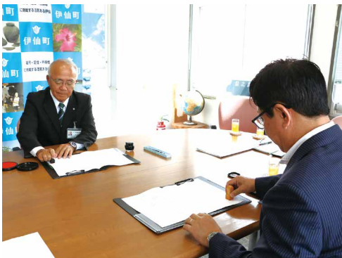
共同発行に関する協定書に双方でサイン