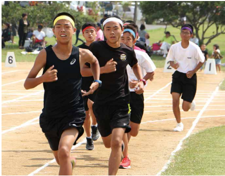
⑦ 1500メートル走 (中学生男子)