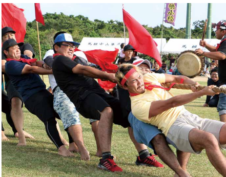
⑫ 綱引き決勝戦 犬田布校区