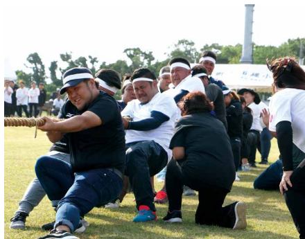
⑬ 綱引き決勝戦 面縄校区