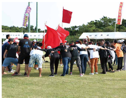
⑪ 綱引き決勝戦を前に円陣を組む犬田布校区