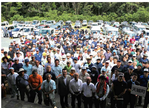
参加したボランティアの皆さん

関係者からは「当初の計画ではこのような規模の清掃会は想定していなかった。計画を進めていくなかで賛同者が増え、このような大規模な清掃会を開催することになった。世界自然遺産登録に向けての島民の機運が醸成されていることを感じ、とてもうれしい」との声が聞かれました。