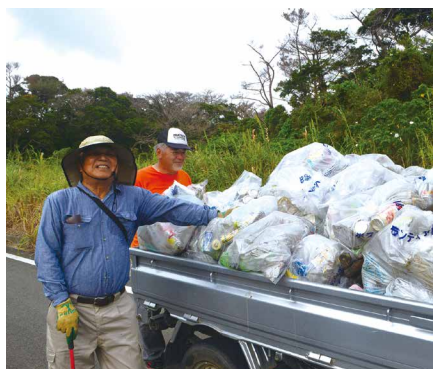
軽トラックに満載された回収ゴミ

また、参加者からは「車で通るとゴミが落ちてるのが分らないが、歩いてみるとゴミの多さにびっくりした。未来の子どもたちの為にも、ゴミのポイ捨てはやめてほしい」と「またこのようにイベントが開催される時は、ぜひ参加したい」との感想が聞かれました。