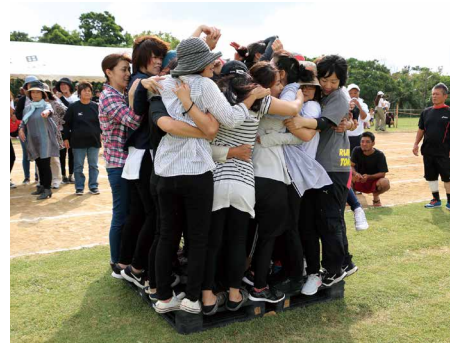
⑨ 何人乗れるかを競う 夢舞台