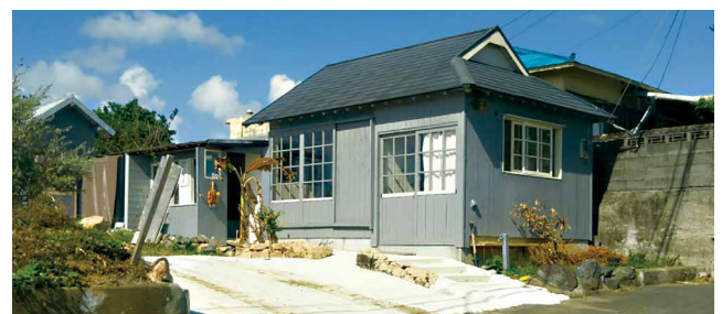
コーヒーの木研究室