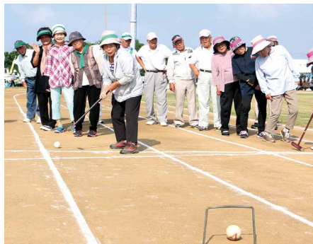
⑤ ゲートボールリレー