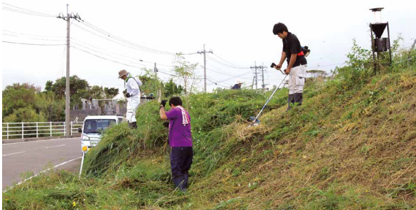
義名山近くの伊仙池 除草作業