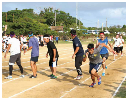
⑯ 最終種目 男子400メートルリレー