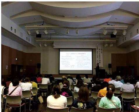
約30名の関係者が参加しました