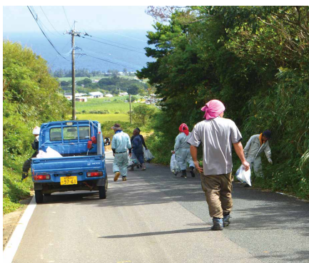
道路脇に捨てられた空き缶などを回収