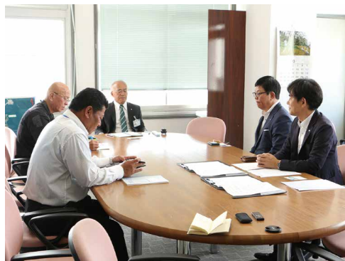
暮らしの便利帳について意見交換

立てれば」と今後の展望について、抱負を語りました。暮らしの便利帳は全国で約900の自治体で発行されており、奄美群島内では3例目となります。