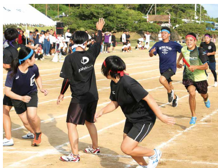
⑮ 高校生対抗リレー