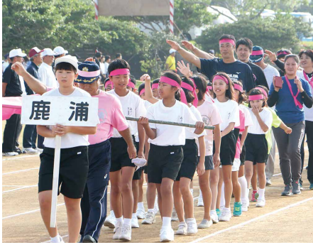
① 8校区選手団による入場行進