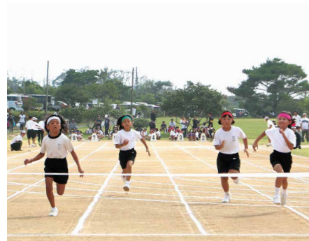
⑥ 100メートル走 (小学生女子)