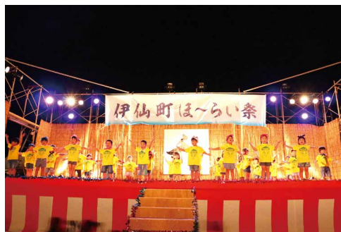
保育園児の舞台発表