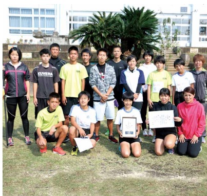
伊仙校区の選手の皆さん Aチームは、大会4連覇を達成