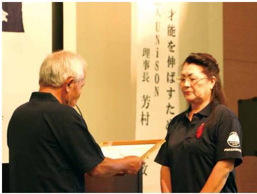
民生委員・児童委員永年勤続表彰