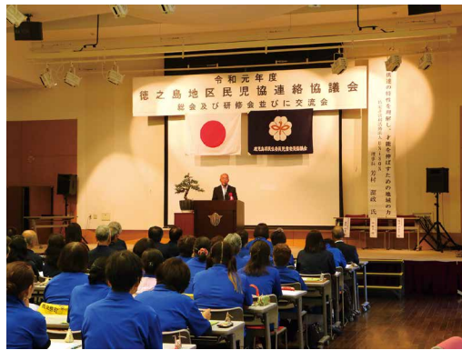
研修会に臨む民生委員・児童委員の皆さん