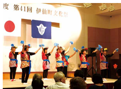
レクリエーションダンス