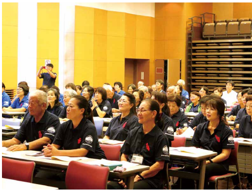
三町から関係者が集まりました