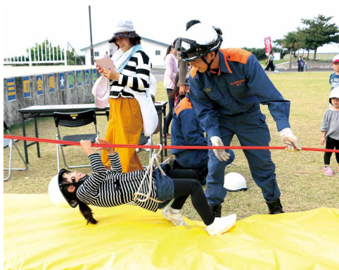
ロープを使った模擬訓練を体験