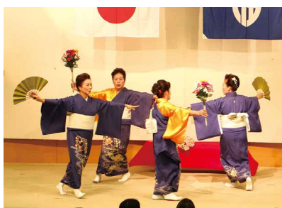
日舞 (仙田流糸駒教室)