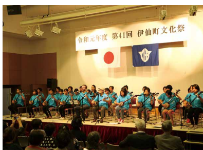
島唄・三味線同好会