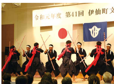
西伊仙東 棒踊り保存会