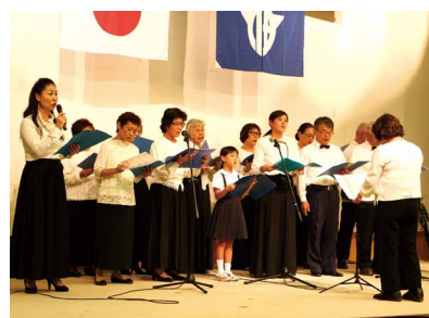
ひまわりコーラス