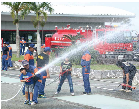
消防団員の皆さんと放水体験