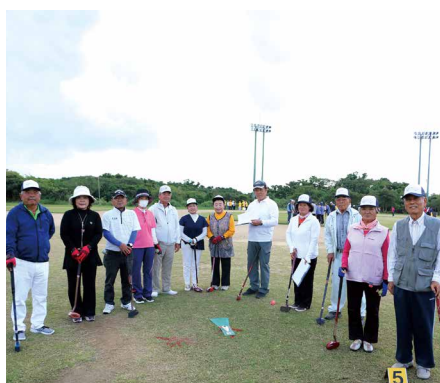
奄美市と伊仙町のチームが記念撮影