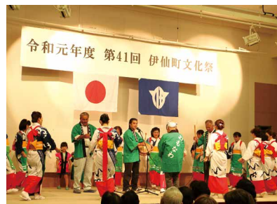
上面縄 ションマイカ同好会