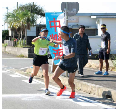
6区から7区ヘタスキリレー 難所の登り坂が待ち受ける