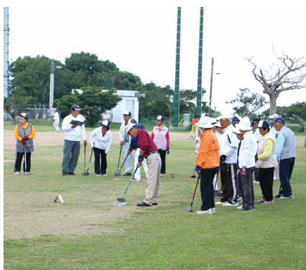
競技開始の合図が鳴り一斉に競技開始