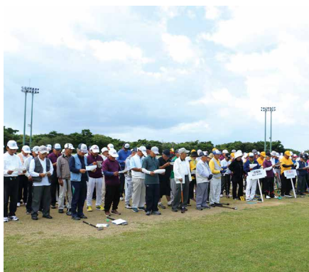
開会式で日本復帰の歌を歌う選手の皆さん