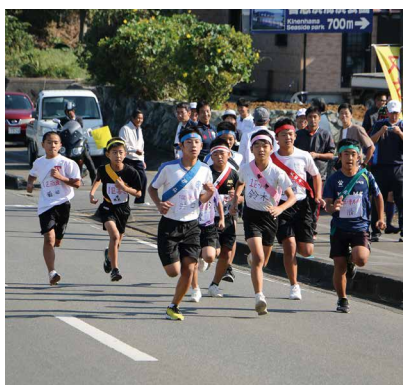
1区小学男子(1.7km) 号砲の合図で、 勢いよく飛び出す選手の皆さん