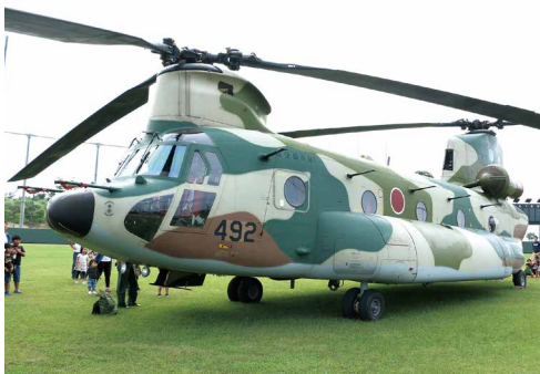
自衛隊ヘリコプターを間近で見学

復旧活動に携わる自衛隊や消防団の皆さんから、直接話を聞くことができたことで、災害や防災について考える良ききっかけになったと思います。