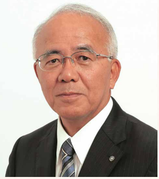
伊仙町 町長 大久保 明

町民の皆様、新年あけましておめでとうございます。昨年は、本町の取り組みについて、町民の皆様の御支援をいただき厚く御礼を申し上げます。