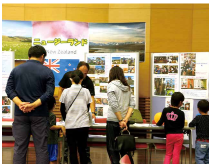
ニュージーランドの紹介コーナー

第43回産業祭・食の文化祭終了後に、同会場で徳之島インターナショナルDAYが開催されました。ホストタウン登録に至っているポスニア・ヘルツェゴビナの紹介や前年度実施したニューージーランド派遣プログラム、今年度派遣予定のフィリピンの事業内容の紹介が行われました。また、インターネット中継を通じて、フィリピンの現地の人と英会話に触れるなど、来場した保護者の皆さんや子どもたちも興味津々でした。