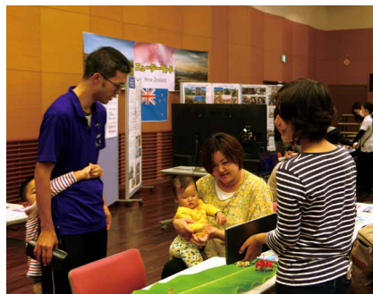
インターネット中継を通じて、フィリピンの現地の人と英会話を体験

第43回産業祭・食の文化祭終了後に、同会場で徳之島インターナショナルDAYが開催されました。ホストタウン登録に至っているポスニア・ヘルツェゴビナの紹介や前年度実施したニューージーランド派遣プログラム、今年度派遣予定のフィリピンの事業内容の紹介が行われました。また、インターネット中継を通じて、フィリピンの現地の人と英会話に触れるなど、来場した保護者の皆さんや子どもたちも興味津々でした。