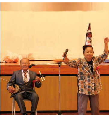
三味線に合わせて酒瓶を頭に載せる踊りを披露

徒競走では、各チームから6名ずつ参加し、体育館内のコートを走りました。ボーリングリレーでは、車椅子を利用していらっしゃる皆さんも一緒に参加し、瓶を狙ってボールを転がし、楽しみながら参加していました。車椅子が手放せない高齢者の方でも、競技に参加できるよう工夫が生かされていました。参加者の皆さんは、スポーツを通じて親睦を深めました。