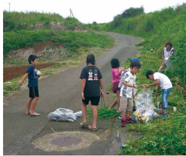
ごみを回収する子どもたち

農業者以外にも参加するこの活動は多面的機能の維持・発揮を図る素晴らしい活動と評価されています。毎年、ビールを持参された参加者は替刃を配布していましたが、今年度は新たに、ビールを持参していない方には伊仙中部緑風会のタオル、参加した子どもには文具券の配布を行いました。地域の多面的機能の維持・発揮を図る活動が更に広まるよう期待したいと思います。