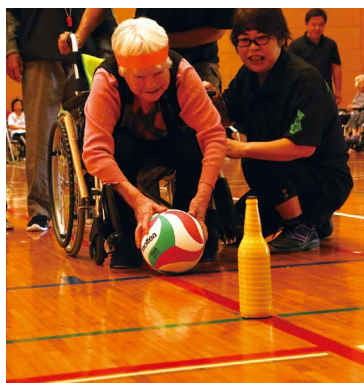
ボーリングリレー