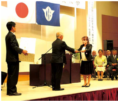
各部門における表彰式が行われました