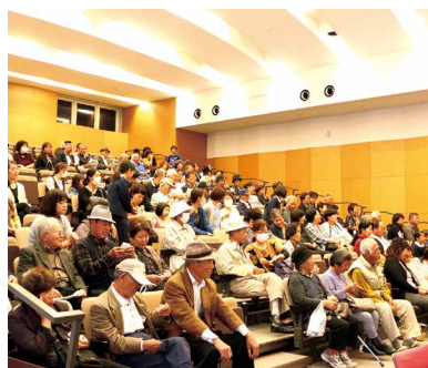
悪天候のなか、来場された皆さん

では推計で、年間2,842万トンもの食品が廃棄されており、このうち食べられる食品の廃棄が646万トンに達していることを冒頭で話し、食品ロスに関する問題を提起しました。私たち一人一人が食品ロスに関して、関心を持ち、できることを「ちよつとづつ」積み重ねていくことが食品ロスを減らすことにつながると語り、「普段から買い過ぎたり、料理を作り過ぎたりしていませんか考えてみてください」と会場の皆さんへ語りかけていました。