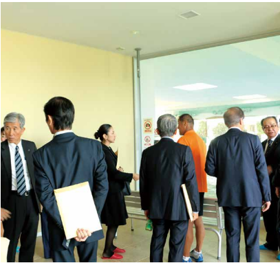
徳之島交流ひろば「ほーらい館」の施設見学