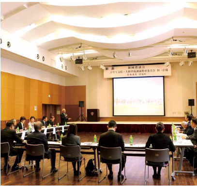
町側と子育てを中心に意見交換を行う福岡県議会の視察団

子育て世帯への優遇措置として、小規模校区に町営住宅を建設しており、家賃の減免を行い、入居を促す取り組みを紹介しました。地域においては、高齢者が参加している地域サロンに、子どもたちも参加しており、高齢者が子どもたちの面倒を見るなど、地域で役割を担って活躍している事例についても紹介があり、地域力の高さに関心を寄せていました。