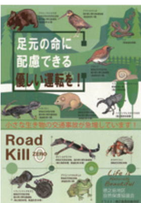
■ロードキル防止ポスター