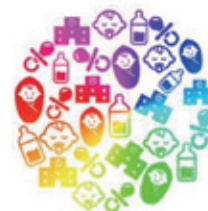
子育て支援に関する事業