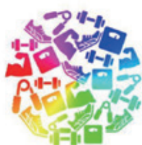
健康増進に関する事業