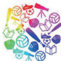
青少年育成に関する事業