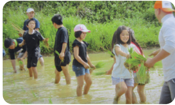
●集落共同農地(田んぼ)整備事業