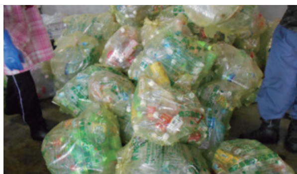
伊仙町のペットボトル分別状況