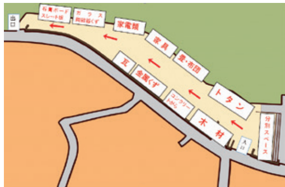
【災害ごみの配置図】