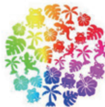
環境保全に関する事業