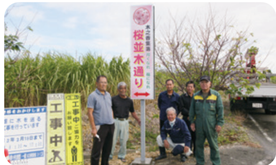
●木之香集落活性化の為の看板設置事業