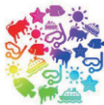
観光及び定住促進に関する事業