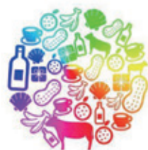
特産品開発に関する事業