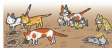
「もっと飼いたい？」環境省パンフレットより