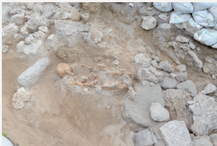
●新しく発見された人骨(中央)と石棺墓(右下)

晩期末く弥生時代前期(今から2,900〜2,800年前ごろ)相当期の土器や貝製品、ヒスイ等が見つかっています。ヒスイは新潟県糸魚川産であることが判明し、この時期には遠くの地域との交流があったことが窺えます。 もう一つの石棺墓の内部は調査されなかったため、現在も砂丘の中に被葬者が埋蔵されている可能性があります。 現在は、発見された地名をとって「佐弁トマチン遺跡」と遺跡名が変更され、調査・研究がなされています。