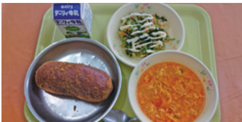
●「TT兄弟スープ」の具材はたまごやトマト等「T」が頭文字の食材がたくさん。

また、受賞した献立を提案した児童・生徒には11月23日に開催された産業祭・食の文化祭で賞状等が授与されました。