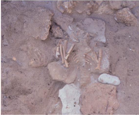
●平成 4 年 発見された人骨とお墓の様子