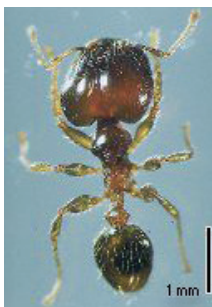
(動物：1種) ・ツヤオオズアリ 【引用：日本産アリ類画像データベース2008】

これらの動植物は、適切な施設で飼養や栽培を行うこと、その施設外で放出や植栽をしないこと、販売する場合は購入者に指定外来動植物であることなど、取り扱いに注意が必要です。 この2種類を含めて、これまで22種類が指定されています。 詳細は、鹿児島県のホームページ（県内外来種で検索）をご覧ください。