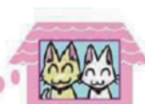
「宣誓！無責任飼い主0宣誓！！」環境省パンフレットより

各町の飼い猫の適正な飼養及び管理に関する条例を守り 最後まで愛情と責任をもって飼いましょう！