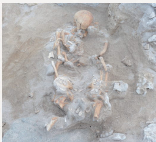
●新しく発見された人骨の様子

伊仙町教育委員会は、平成28年度、平成30年度、令和元年度に佐弁トマチン遺跡の墓域の広がりや内容を確認するために発掘調査を行いました。その結果、鹿児島大学埋蔵文化財調査センターが調査したお墓よりも東側の砂丘中から埋葬人骨を発見しました。人骨は大腿骨(太ももの骨)の途中から足先が消失していました。埋葬された人骨は壮年男性であることがわかりました。人骨には石棺墓が構築されていたと考えられますが、発見時は2個の石灰岩が残っているだけの状態でした。