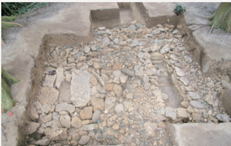
●鹿児島大学が調査した 2 基の石棺墓の様子

ばれていました。その後、平成16～20年度にかけて、鹿児島大学埋蔵文化財調査センターによって発掘調査が行われました。調査の結果、石灰岩で組まれたお墓（石棺墓）2基と砂を掘ったお墓（土壙墓）1基が見つかりました。石棺墓の1つは3段構造になっており、合計4個体分の人骨が埋葬されていました。人骨を科学分析に出した結果、約2,400～2,100年前のものであることが明らかになりました。お墓の中からは、縄文時代