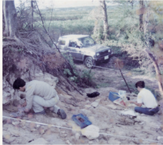
●平成 4 年 調査の様子

佐弁トマチン遺跡は、伊仙町の東側に形成される海岸部標高15mほどの砂丘上にあります。砂丘は佐弁集落の共有地となっており、一昔前ま