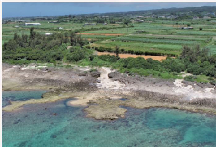
●海上から佐弁トマチン遺跡を臨む(中央部)

晩期末く弥生時代前期(今から2,900〜2,800年前ごろ)相当期の土器や貝製品、ヒスイ等が見つかっています。ヒスイは新潟県糸魚川産であることが判明し、この時期には遠くの地域との交流があったことが窺えます。 もう一つの石棺墓の内部は調査されなかったため、現在も砂丘の中に被葬者が埋蔵されている可能性があります。 現在は、発見された地名をとって「佐弁トマチン遺跡」と遺跡名が変更され、調査・研究がなされています。