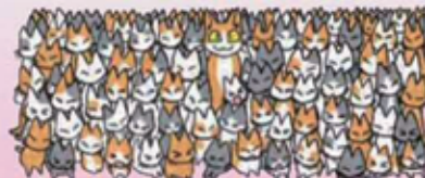
「捨てず増やさず飼うなら一生」環境省パンフレットより