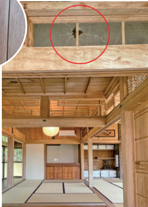
●屋敷内に残る銃弾の跡

前号にて完成をお知らせいたしました阿権集落の前里屋敷は、戦時中の機銃掃射による銃弾の跡や歴史を感じさせる梁（はり）や柱など、築90年以上の古民家の古き良き風情を残し改修されました。