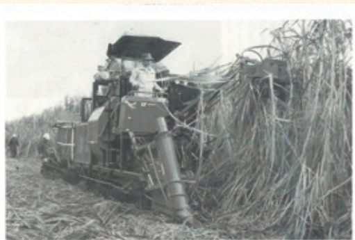
ほ場で稼働中の小型ハーベスター

頼もしい助っ人 小型ハーベスター 今期の製糖よりいよいよ小型ハーベスターが稼働をはじめました。農家の高齢化が進み、後継者不足が心配される現在、さとうきび生産農家にとっては収穫作業の省力化が一番の悩みのタネでした。 頼もしい助っ人となるべく登場したのがこの小型ハーベスターです。徳之島農協が事業主体となり、株式会社有力化生産体制整備事業で導入した小型ハーベスターの一日の稼働能力は約20tで、農協が窓口となり、1当たりも、000円で受託作業を行っています。 受益者からも、毎年一台ずつ導入予定であり、農家から熱い期待が寄せられています。