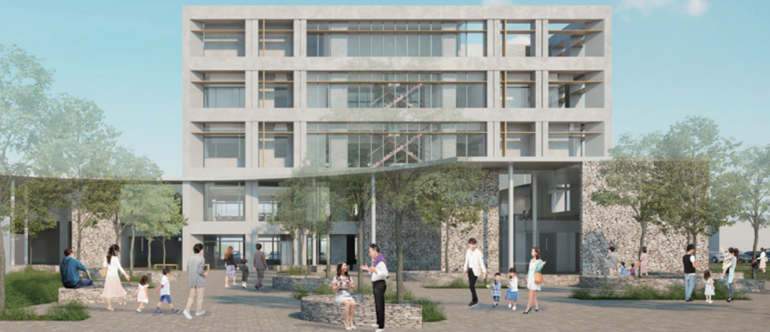
■新庁舎完成イメージ