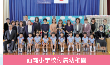
面縄小学校附属幼稚園