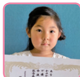
ひろ きこ 廣 輝子 キャサリン ちゃん