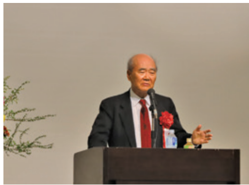
● 第8代ユネスコ事務局長 松浦氏講演の様子