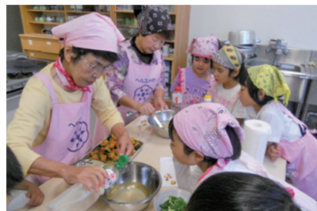
●学童にて調理実習風景