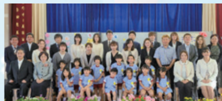
面縄小学校附属幼稚園