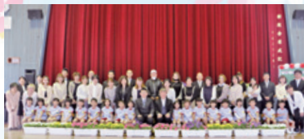
伊仙小学校附属幼稚園