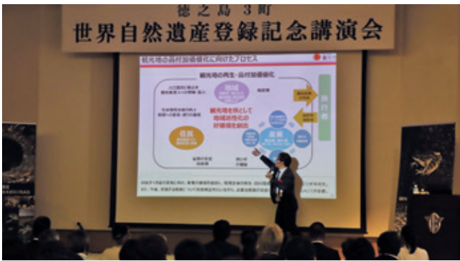
● 観光庁観光地域振興部観光資源課長 星氏講演の様子