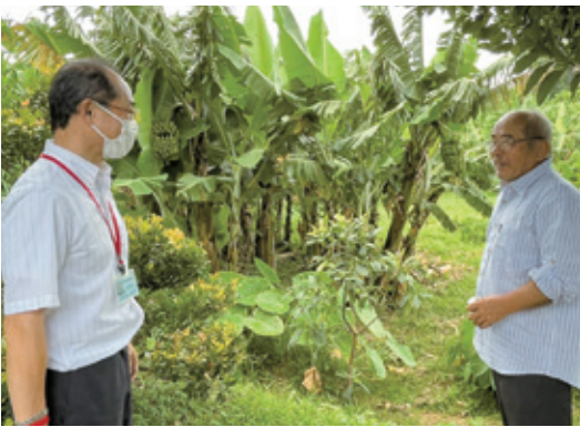
●バナナ農家さんを訪問

鹿児島県という温泉のイメージがあったので、伊仙町にも温泉があると思っていました。私たち家族は温泉が大好きで、老後は温泉三昧ができる場所で暮らしたいと思っていましたが、温泉に負けない