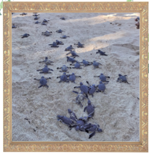
タイトル 『子宝島』 投稿者：Sさん(東伊仙)

誕生日やイベントなどの記念写真、面白風景や ハプニング写真、お気に入りの写真などジャンル は問いません。