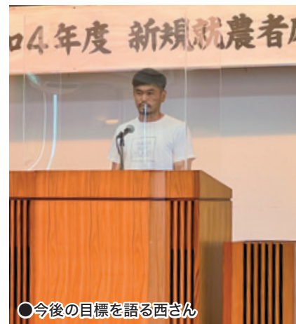
●今後の目標を語る西さん