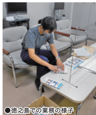
●徳之島での業務の様子

この平和があるのは、為さんたち自衛官の日々の努力あつてのことです。今後ますますのご活躍を応援しています。