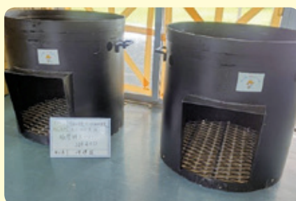
■西犬田布集落 かまど