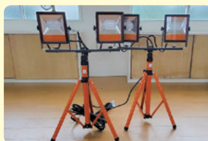
■東伊仙西集落 スタンドライト