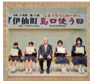
タイトル 『島口つこわーデー』

下記、二次元コードを読み取り、必要事項をご記入のうえ、写真データを添付してご応募ください。