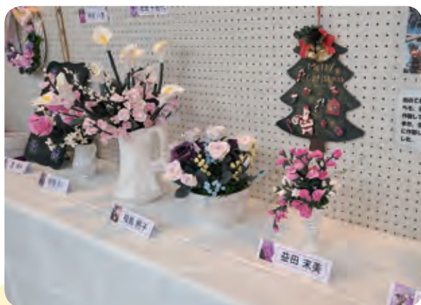
■ソフト粘土のお花

公民館講座の受講料は、 一講座につき1,000円 （複数受講可・材料代等は自己負担）です。申し込み時に公民館でお支払いください。（お釣りのないようお願いします。）