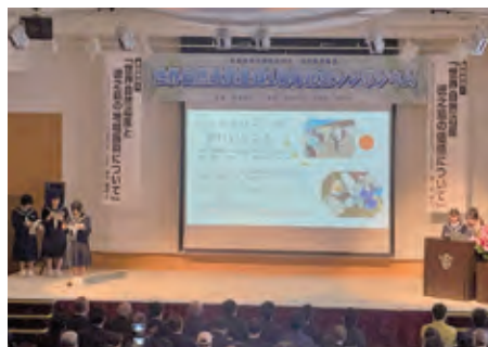
■伊仙中学校による学習発表