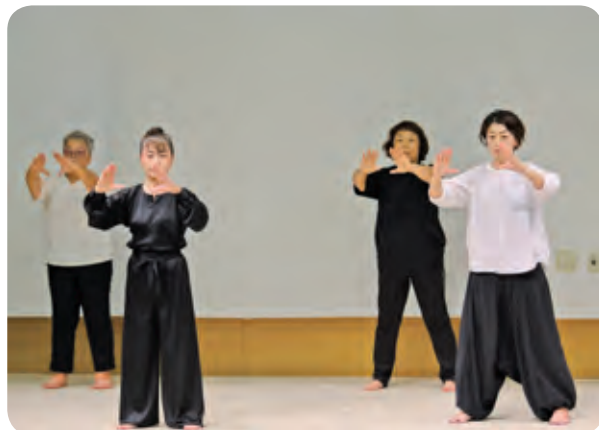
■花架拳 発表の様子