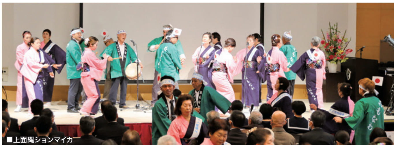
■上面縄シヨンマイカ