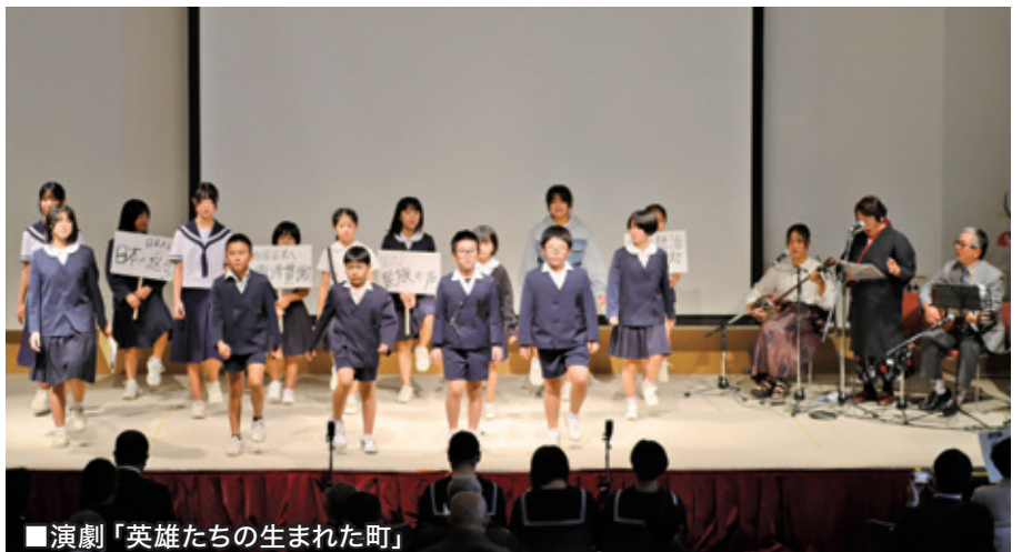
■演劇「英雄たちの生まれた町」