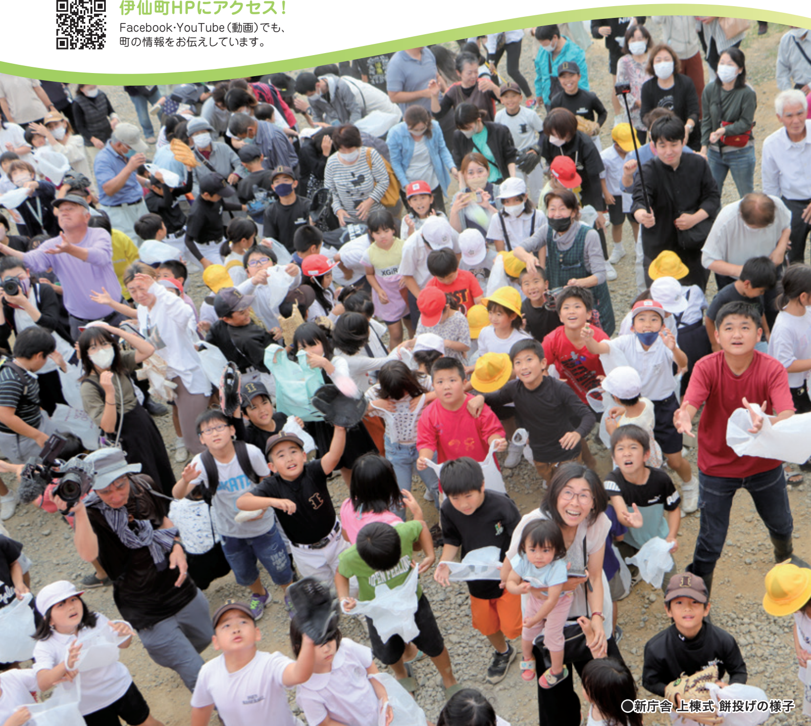
○新庁舎 上棟式 餅投げの様子