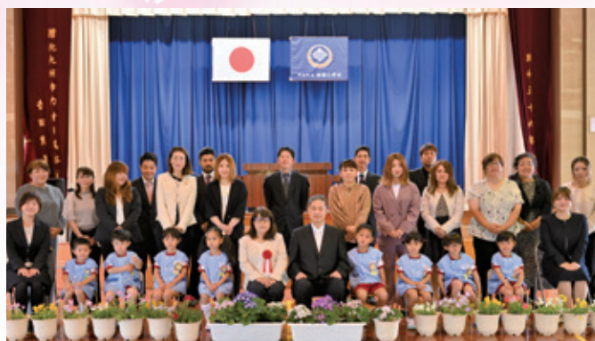
面縄小学校付属幼稚園