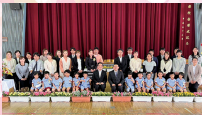
伊仙小学校付属幼稚園