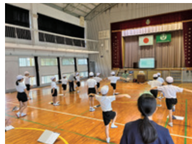
■ロコモチェックの様子

伊仙町では、今年度から年間を通して、小学校8校、中学校3校の計11校で子どもロコモチェックや予防の体操を行います。