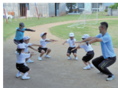
■予防体操にも取り組みます!!