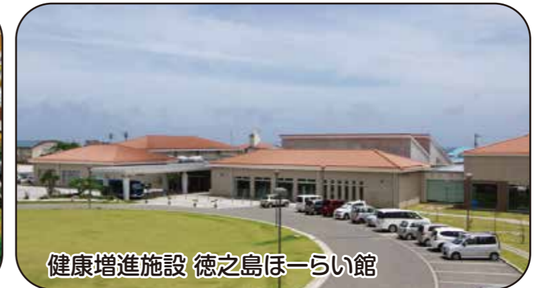
健康増進施設 徳之島ほーらい館