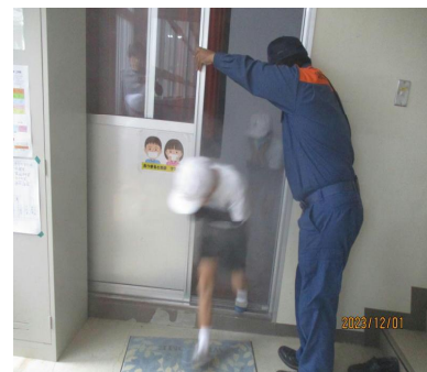
【多目的室から避難】

火事をおこさない（火遊びをしない）、火事になったら大人の助けを呼ぶなど、多くの学びがあった避難訓練となりました。