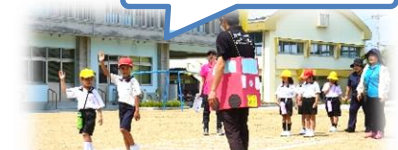
左右確認 手をあげて

地域での子どもたちの様子で気になる言動があったときは、ぜひ学校にもお知らせください。