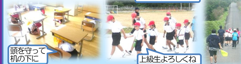
頭を守って机の下に

4月14日。緊急地震速報後の津波警報発生を想定して、避難訓練を行いました。直後に東北・北海道での地震が発生し、普段からの訓練の大切さを感じることができました。