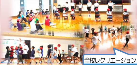
全校レクリエーション