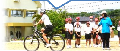
交通ルールを守って乗ろう