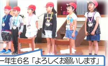
一年生6名「よろしくお願いたします」