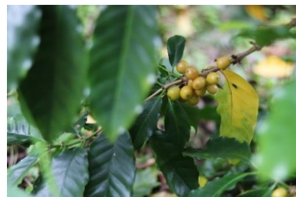
黄色い品種のコーヒーチェリー。