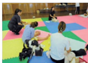
■すくすく親子推進事業