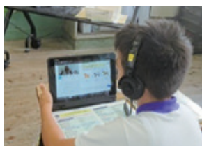
■オンライン英会話事業

企業版ふるさと納税とは、 国が認定した地方公共団体の 地方創生プロジェクトに対し て企業が寄附を行った場合に、 法人関係税から税額控除する 仕組みです。