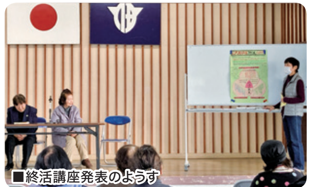
■終活講座発表のようす