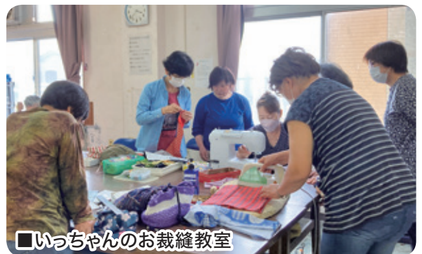
■いっちゃんのお裁縫教室