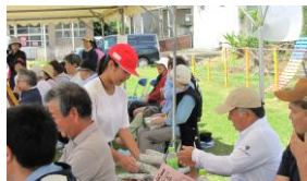
【感謝の気持ちを込めて】