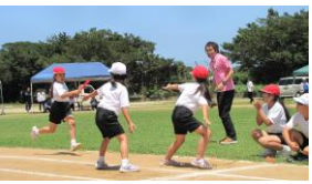
【紅白対抗全員リレー】