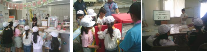
【郵便局のお仕事を調べよう】 【ポストの中は初めて見ました】 【給食の秘密は何?】

5月21日(木)に1～4年生が、春の一日遠足に行きました。まず、鹿浦郵便局に行き、次に給食センターに行きました。どちらも分かりやすく教えていただき、とても勉強になりました。最後に瀬田海海岸に行き、お弁当を食べて、海岸で遊びました。とてもいい一日になりました。