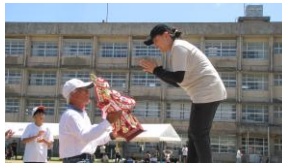
【優勝トロフィー授与(地域)】