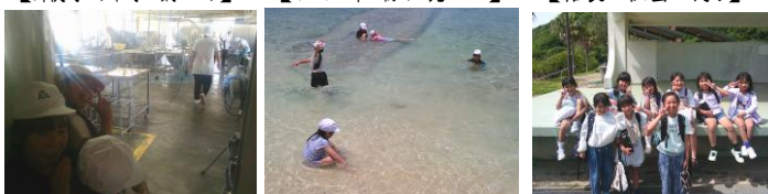
【給食を作ります】 【海遊び、気持ちいい】 【楽しい一日でした】